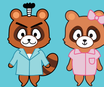
ころ左エ門 ころ美 医療法人美衣会 公式キャラクター